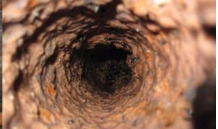
Visste du att vi har 1,5 mil avloppsledningar som nu har fått en välbehövlig genomgång